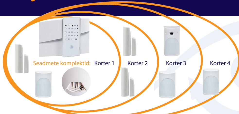
Seadmete komplektid: Korter 1